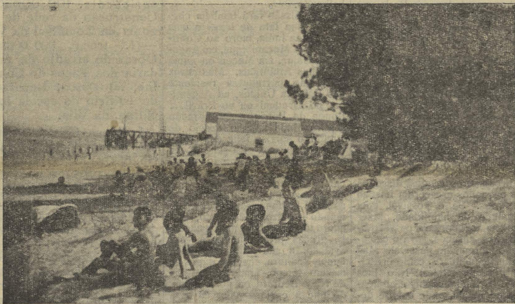
Praia de Santo António — A praia popular que vai ser servida por um caminho de acesso, cujas obras devem iniciar-se brevemente.