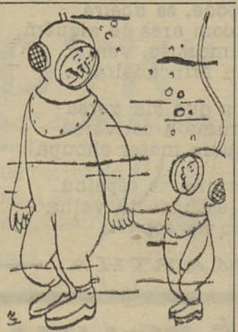
— Papá, chlohi!

NO esplêndido cenário de Monte Gordo, viveram-se, na manhã da passada terça-feira, momentos de grande entusiasmo. O Concurso Infantil das Praias de Portugal, simpática iniciativa do «Diário de Notícias» que tão brilhante êxito tem obtido nas principais praias do País, foi acolhido pelos jovens «artistas» da colónia balnear de Monte Gordo — representando famílias de todo o Algarve, Baixo Alentejo e Lisboa — com excepcional interesse.