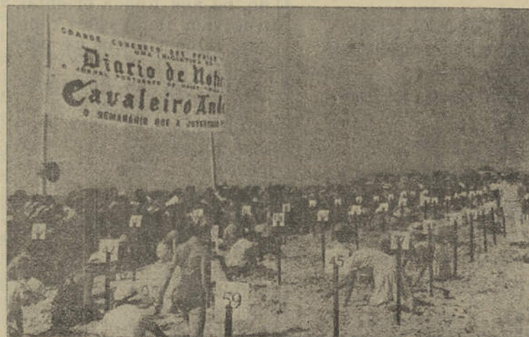
Um aspecto do concurso das construções na areia realizado em Monte Gordo, o ano passado