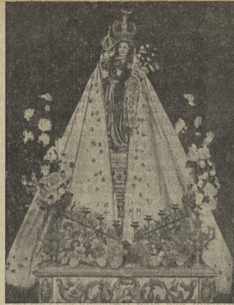
Imagem de Nossa Senhora dos Mártires

Do programa, que já se encontra elaborado, fazem parte, no dia 14, alvorada, pela Banda de Castro Marim; missa, com cânticos, às 10 horas; um grandioso festival de ciclismo, às 17 horas; e, à noite, quermesse, arraial e concerto pela Banda de Castro Marim, um dos melhores agrupamentos musicais do sotavento algarvio. No domingo, dia 15, haverá alvorada pela Banda da-