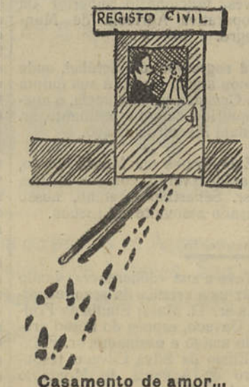
Casamento de amor...