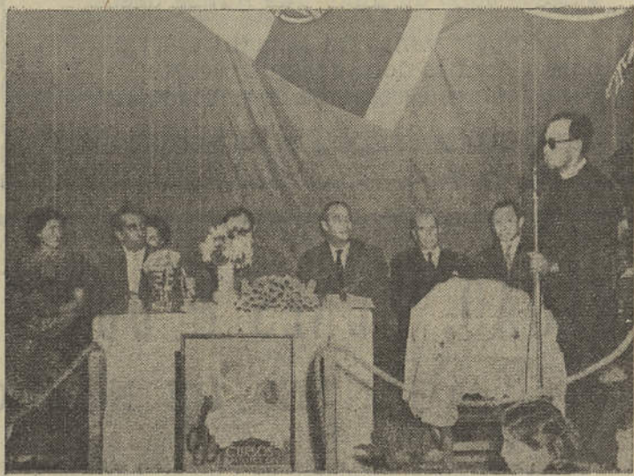
Durante a sessão solene