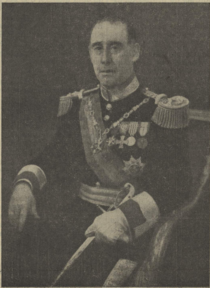
General Craveiro Lopes