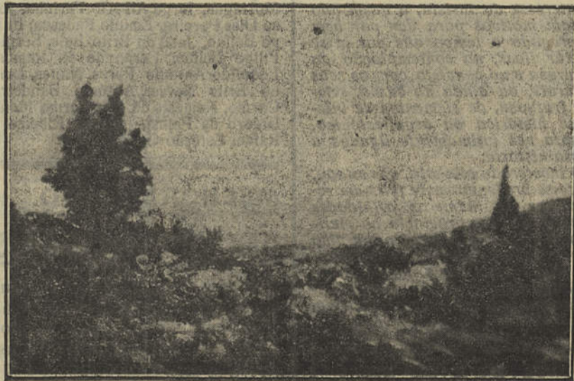
Paisagem algarvia — Óleo do pintor Lyster Franco

tugal, o Criador colocou propositadamente, nos seus extremos, duas provincias igualmente belas, igualmente risonhas, igualmente animadas do mesmo optimismo e da mesma alegria de viver.