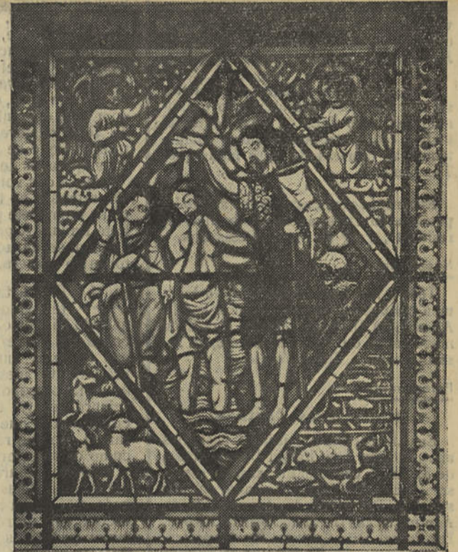
Baptismo de Cristo, no rio Jordão (Baptistério)