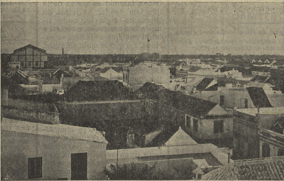
Vila Real de Santo António — Vista parcial (lado sul)