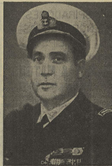
Comandante Henrique Tenreiro

Poucos dias volvidos sobre a visita ministerial, e segundo nos informam, podem anunciar-se os primeiros resultados, bastante prometedores e que revelam o interesse do sr. Ministro das Obras Públicas pela nossa terra: a concessão, pelo Estado, das participações para as obras de saneamento da zona sul da vila e construção da rede de esgotos (Zona 1), e do