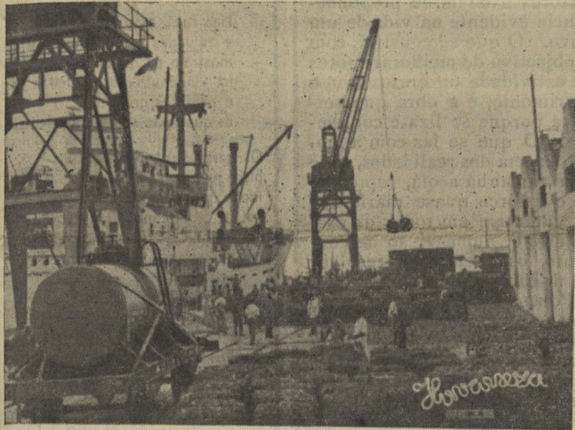
Cais de Vila Real de Santo António