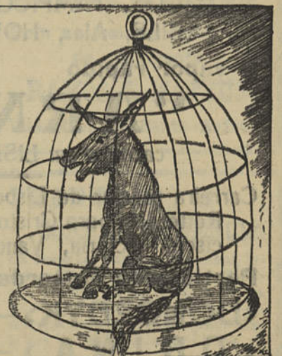
BURRO CANÁRIO — Assobiando a «Vingança» e fazendo outras habilidades, oferece-se para poleiro vago.