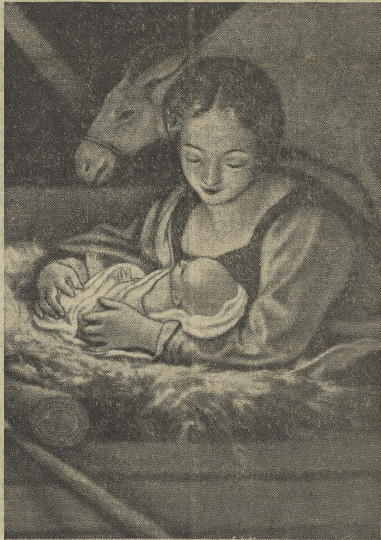
«A Virgem e o Menino»

Aos meus olhos, porém, salta outro drama mais pungente do que este.