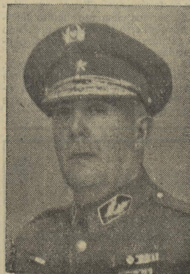
General Leonel Vieira