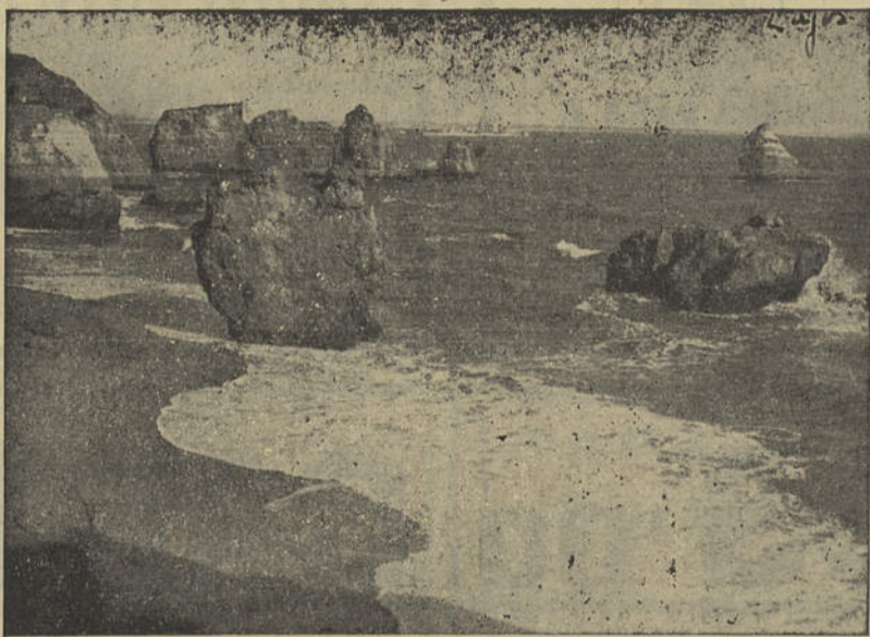
Trecho rendilhado da Costa de Ouro