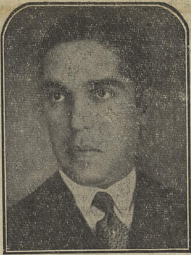
Eng. Duarte Pacheco

INAUGURAÇÃO do monumento ao falecido ministro Duarte Pacheco, em Loulé, transcendeu largamente, pelo seu alto significado, a sincera homenagem da terra ao seu maior e mais ilustre filho, e a consagração dos Municípios do país, para se transformar no preito da Nação agradecida.