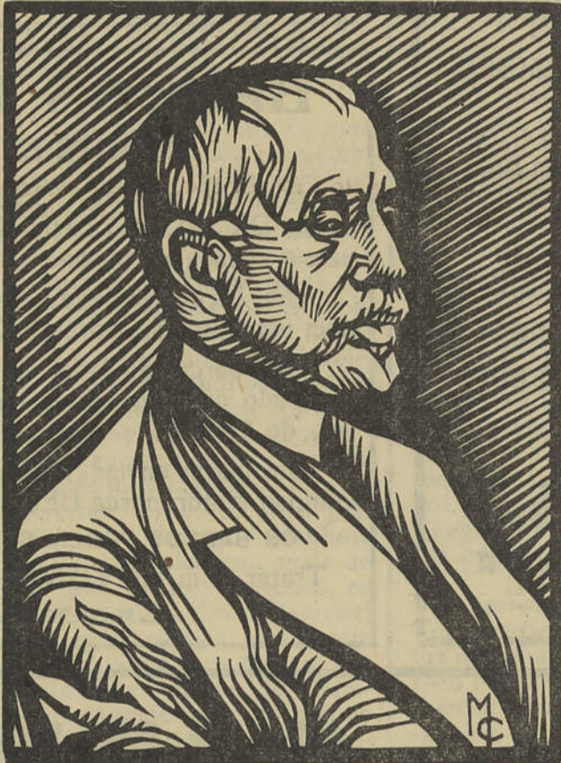
M. Teixeira Gomes (Gravura em madeira de M. Cabanas)

tugal estava ligado à Inglaterra pela aliança secular e a neutralidade era-nos difícil. O Governo português ambicionava-a ferverosamente e, nesse fervor, era secundado pelo nos-