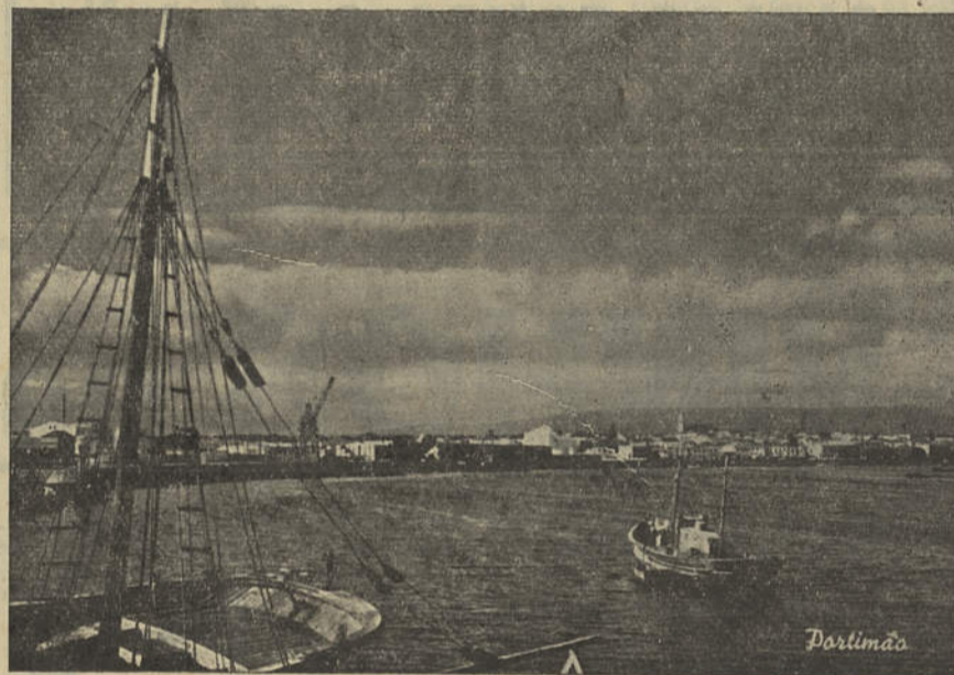
Portimão visto do Rio Arade

Nas largas avenidas que marginam o Arade, sucedem-se as edificações das fabricas de conservas. Aqui impera a industria, e as silhuetas das chaminés que sobem ávidas de luz, são símbolos de força construtora, trabalho, energia. E' tudo isto que faz de Portimão a cidade querida dos forasteiros e o orgulho dos seus filhos; que a eleva num esforço, continuo em que estão empenhados todos os sectores da sua actividade e que tornou em pouco mais de cinquenta anos a ve-