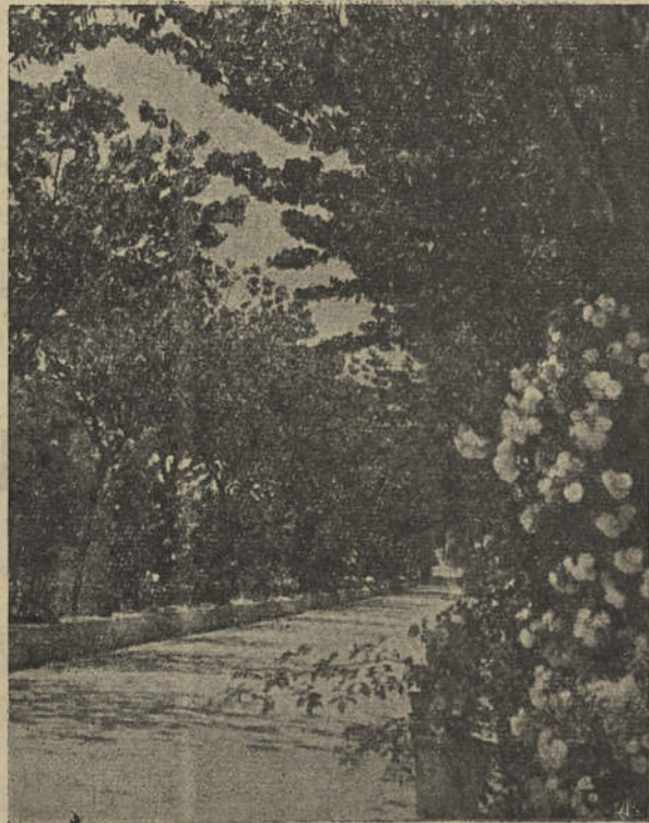
Portimão — Trecho do Parque Municipal

Estão funcionando com regularidade e bastante frequência os cursos de educação de adultos, nesta Vila e em Vila Nova de Cacela.