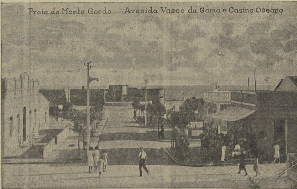
Praia do Monte Gordo — Avenida Vasco da Gama e Casino Oceano

do «Notícias do Algarve», para dar duas modestas e bem intencionadas sentenças sobre Monte Gordo — esta riqueza de praia que nós, os vilarealenses, tanto nos orgulhamos.