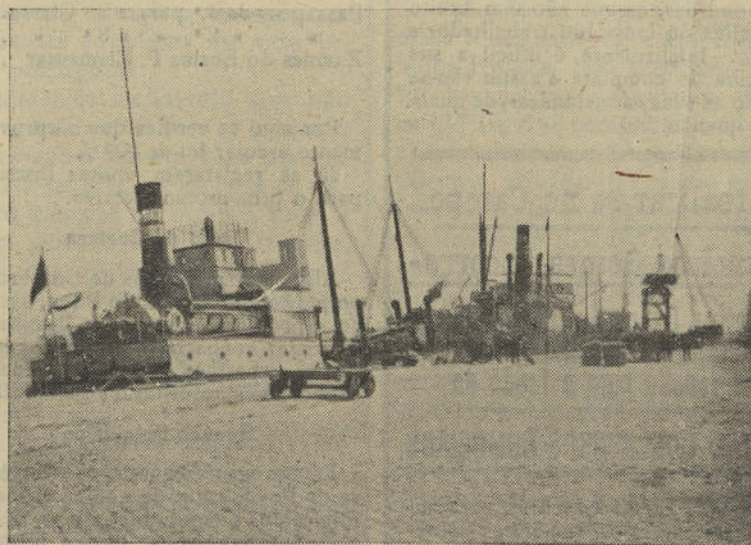
Cais comercial de Vila Real de Santo António