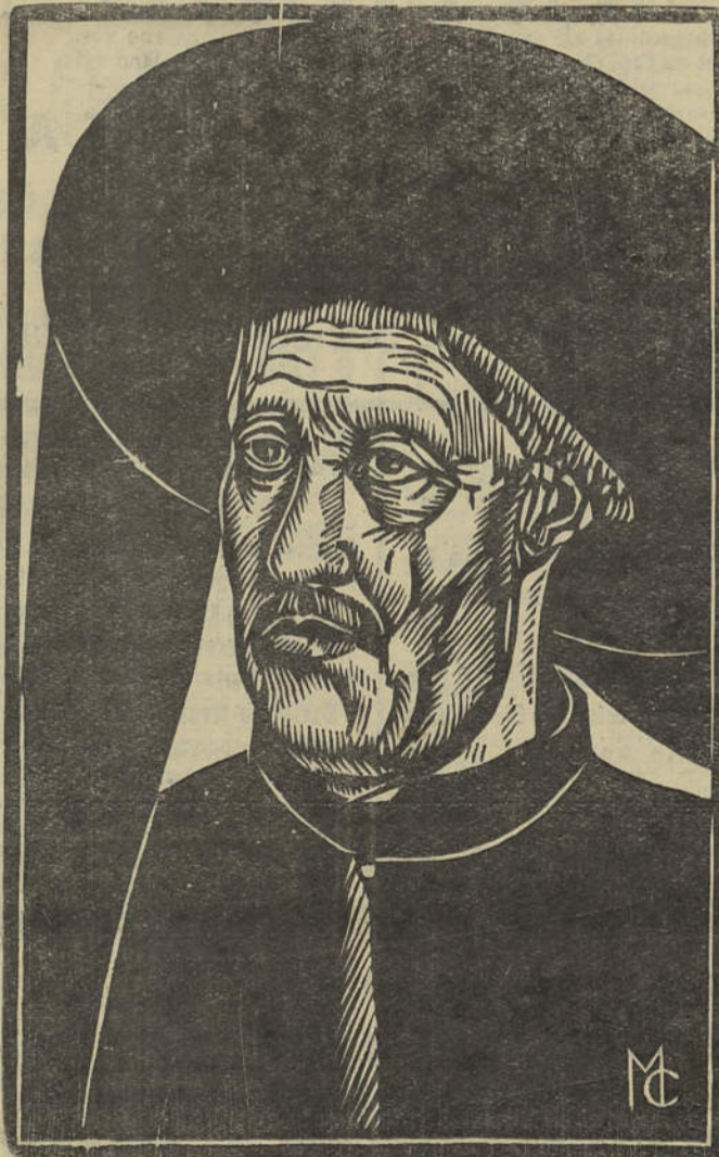
INFANTE D. HENRIQUE, Fundador da Escola Náutica em Sagres

Pátria, nos primórdios da monarquia. Cacela entrou, pois, no domínio português rica e poderosa. Assim o atestam todos os historiadores antigos e