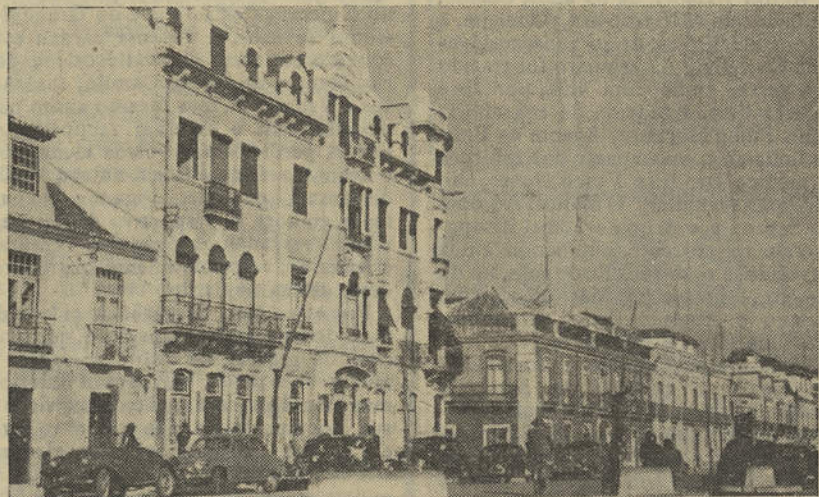
Um aspecto da Avenida da República

precisa de traçar as suas directrizes económico-sociais. Vejamos, assim, os elementos que nos fornece o próprio «Notícias do Algarve», desde o seu primeiro número, referentes ao movimento da lota de Vila Real de Santo António,