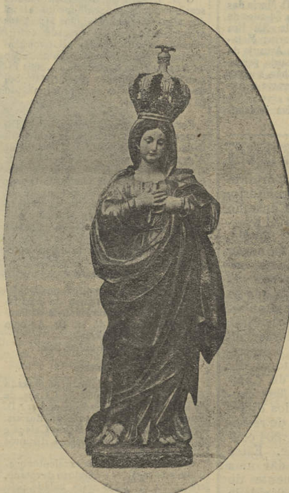
Nossa Senhora da Encarnação

Esta noite, pelas 22 horas, haverá concerto, na Praça Marquês de Pombal, pela banda de Tavira, e outras distrações, além de fogos de artifício.