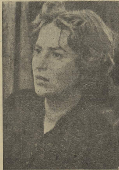
Ela Silvana Mangano.

A artista de «O Lobo da Calábria», «Arroz Amargo» e «Ana» voltará brevemente às nossas telas, no filme «Não Matei» (Il bandito Masolino) ao lado de Amadeo Nazzari.