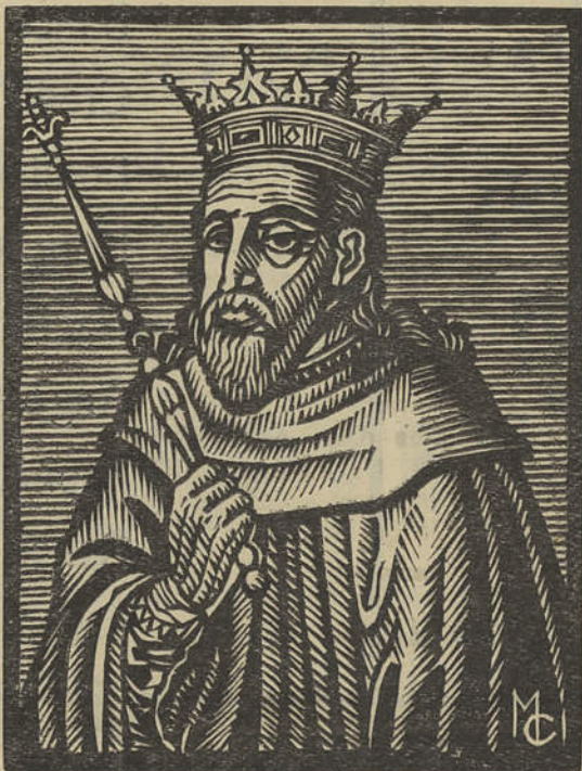
D. SANCHO II, conquistador de Cacela aos mouros

Cacela disfrutava, pois, a honra de ter sido uma das primeiras três terras, conquistadas por D. Sancho II aos mouros, no Algarve. Não podemos positivamente afirmar que fosse Cacela a primeira dessas conquistas, mas somos levados a crer que assim seja, pela ordem por que são citadas por todos os