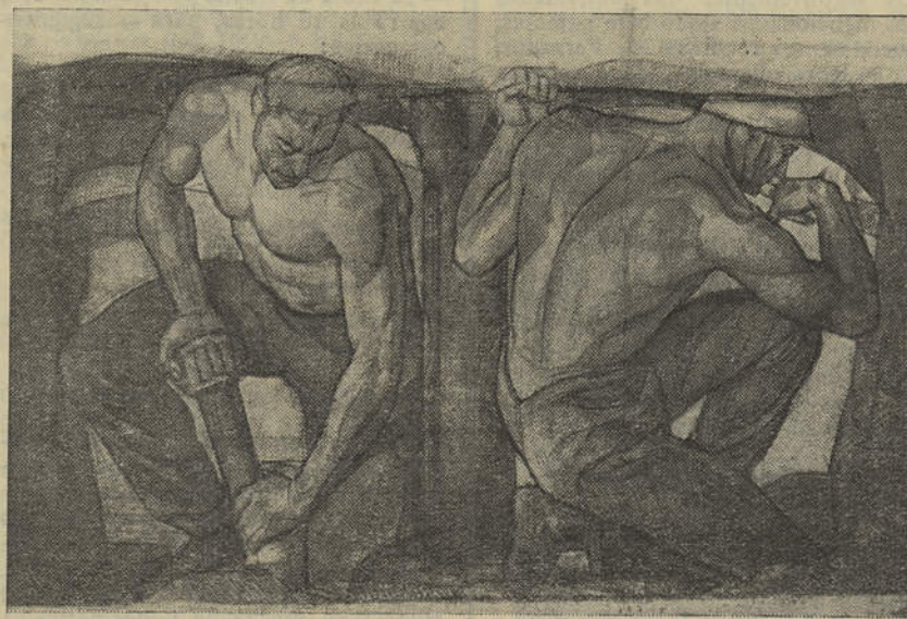
Um aspecto dos «frescos» do Ministério das Finanças