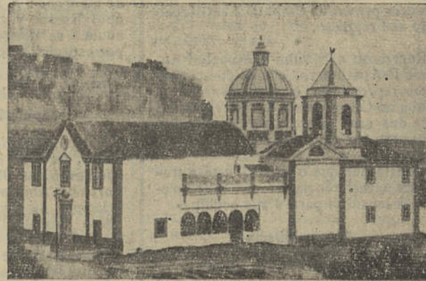
Igreja Matriz — Castro Marim

pósito de proporcionar facilidade de transportes ao elevado número de pessoas que todos os anos, nesta altura, visitam Castro Marim, providenciou de forma a assegurar as comunicações por meio de carreiras extraordinárias de camionetas.