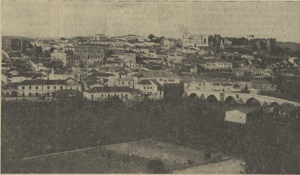
SILVES - VISTA PARCIAL

suas tradições históricas. Depois, o velho moínho do Caninê, numa elevação de terreno que semelha a guarda avançada de uma série de outeiros fazendo rumo à serra, onde cheira a estêvas, onde se cria medronho. E, rodando para