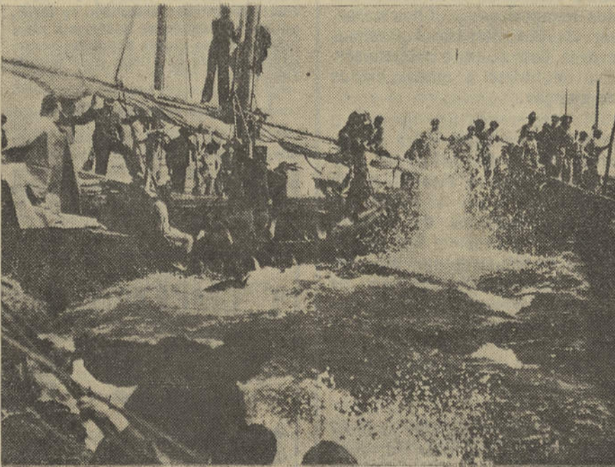
Copejo do Atum na Costa Algarvia

Ainda agora, no acto de posse do novo Governador Civil do (CONCLUI NA 4.ª PÁGINA)