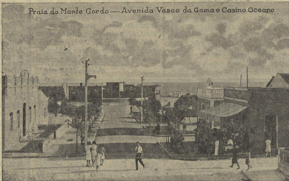
Praia do Monte Gordo — Avenida Vasco da Gama e Casino Oceano

rismo de 1.ª classe não se verifica qualquer actividade em favor do turismo. Noutros tempos, por esta época, ainda aparecia um anúncio num jornal diário da capital a lembrar Monte Gordo. Mas nos últimos anos nada se fez em prol da propaganda turística do concelho. Parecem que todos adormeceram ao arrulho das vagas da nossa praia ou aos afagos cariciosos das brisas le-