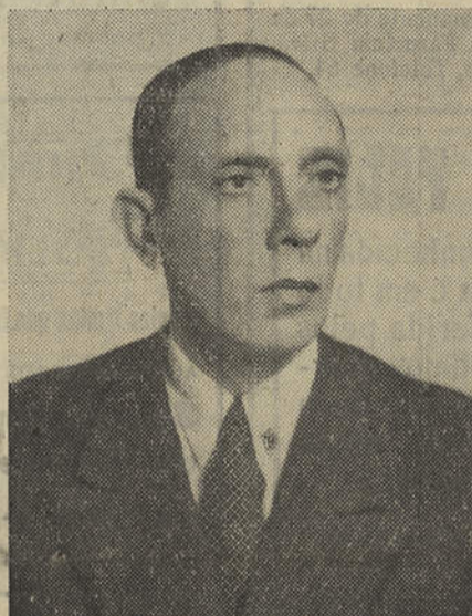
Eng.º Mascarenhas Gaivão Ilustre Governador Civil de Faro

ção das aspirações e interesses de cada um resulta, no conjunto, o desenvolvimento da Província, procuramos obter alguns elementos de informação a este respeito. E o ilustre Chefe do nosso distrito informa-nos que encontrou as Camaras Municipais depauperadas financeiramente e sobrecarregadas de encargos, cada vez maiores, o que muito dificulta a vida dos concelhos e o seu natural desenvolvimento. De facto, impossibilitadas de reunir as verbas indispensáveis para a con-