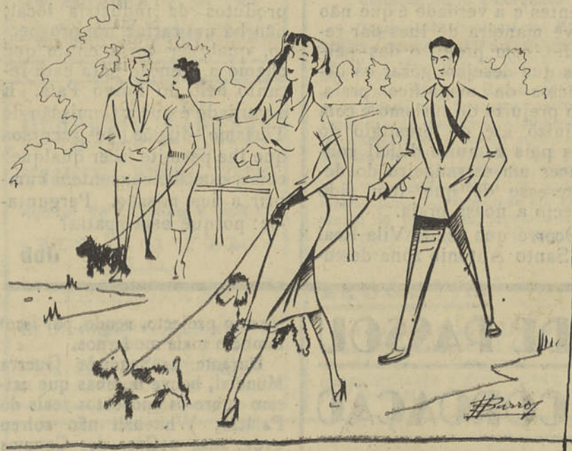
Um aspecto da Exposição Canina

Finalmente no terceiro e último grupo figuram todos — e todas! — os que vão ao Parque das