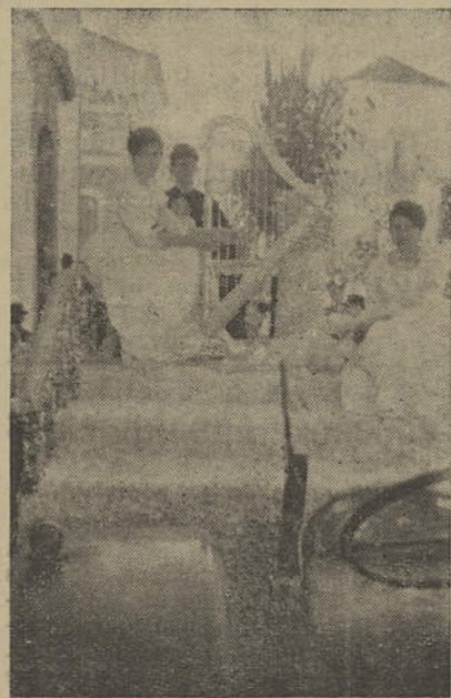
Um artístico carro numa Batalha de Flores de Moncarapacho

NA pitoresca aldeia de Moncarapacho, sede da maior freguesia do concelho de Olhão, trabalha-se com afino preparando as famosas «Batalhas de Flores».