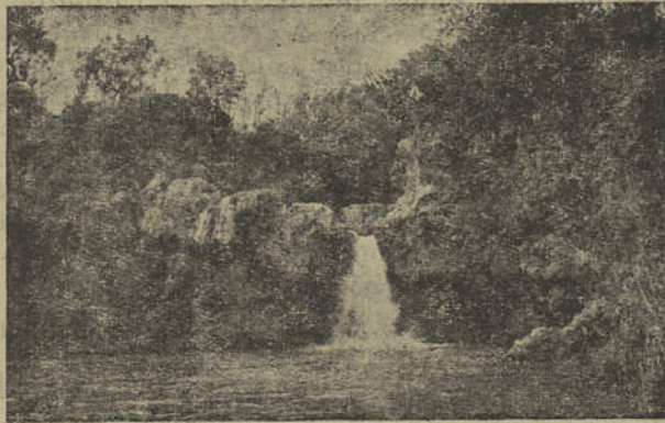
O pitoresco «Pego do Inferno» nos Moinhos da Rocha