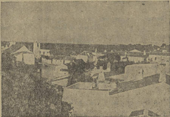
Vista geral da Conceição de Tavira

No próximo dia 15 do corrente, realiza-se na Conceição de Tavira, a sua já tradicional e importante «Feira Franca Anual» de gados, quinquilharias, carroucéis e outros divertimentos. Como complemento, à noite, realiza-se no excelente Parque da Casa do Povo da Conceição, um interessante festival seguido de um grandioso baile abrlhantado por um magnífico conjunto musical.