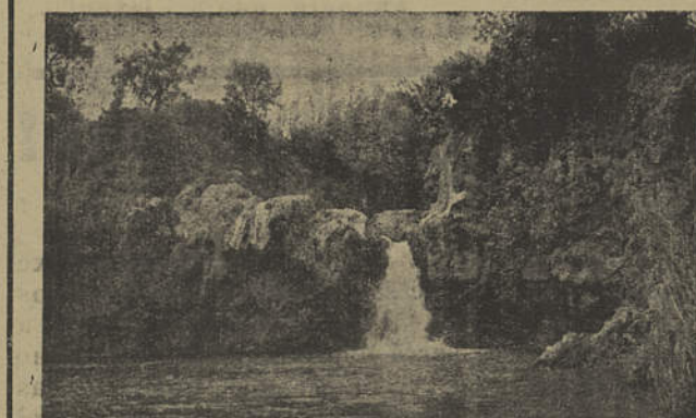
Tavira — local aprazível outrora muito visitado no Dia 1.º de Maio

«Além das praias de areia fina, onde é possível passar muitos dias longe da multidão, uma das maiores atracções do Algarve é o modo calmo como ali a vida decorre. Quem quer, aluga um carro e vai tranquilamente por entre laranjais e figueiras. Veem-se as amendoeiras em flor, as velhas casas caiadas de branco e as residências modernas, as bungavilas e outras plantas semitropicais». Lyster Robison nota, por último, que «em toda a província se encontram hotéis e restaurantes para os mais diversos gostos... e, em todos eles, deliciosos mariscos».