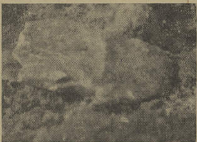
Uma sepultura aos Sobrados ainda intacta

Dentro delas, além dos esqueletos, todos com a orientação oeste-leste, isto é, a cabeça para oeste e os pés para leste, não foram achados quaisquer objectos designadamente metálicos, apesar das sepulturas não apresentarem indícios de terem sido violadas noutras épocas (Fig. 1). Apenas se via uma espécie de tecido muito ténue a envolvê-los que, em contacto com o ar, desaparecia imediatamente. Talvez restos do lençol que envolveu o corpo!