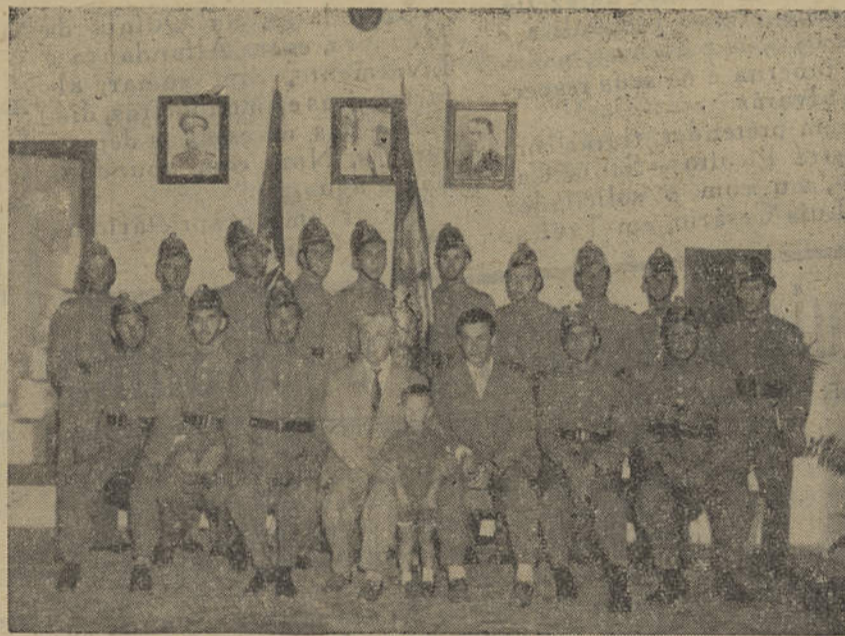
A Corporação dos Bombeiros Municipais de Tavira