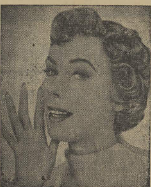
Permanente Neutra e Permanente Frio