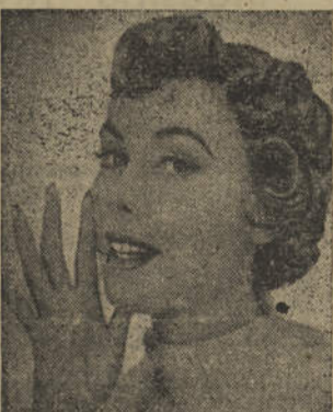
Permanente Neutra e Permanente Frio