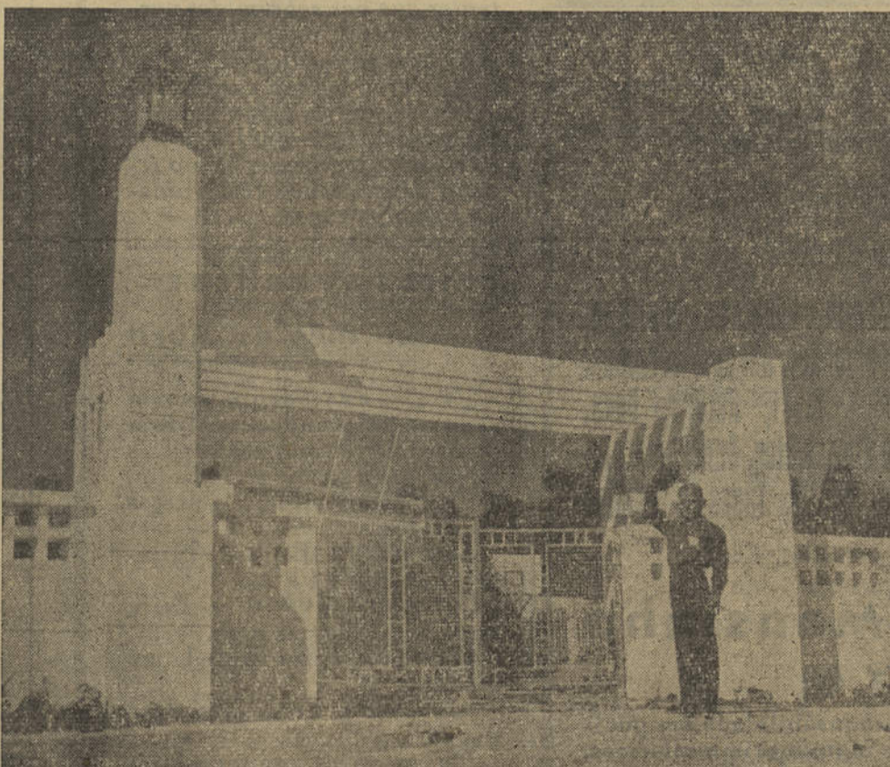
A Casa dos Rapazes de Faro