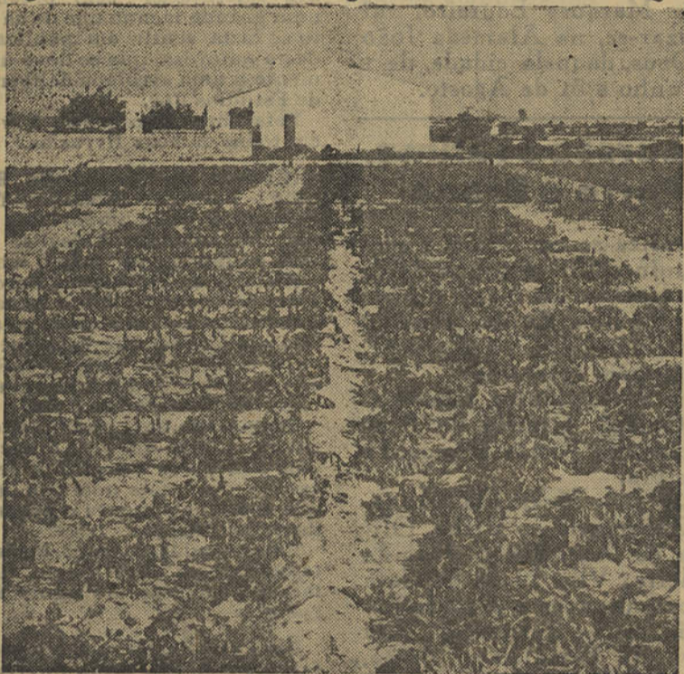
Ensaio efectuado em 1956 no Algarve. No talhão da esquerda, sem tratamento. À direita, tratado com Dithane Z-78 a 0,2%.

Verificamos assim um aumento de produção médio de 3.620 Kg/ha nos talhões tratados com Dithane Z-78. Todos