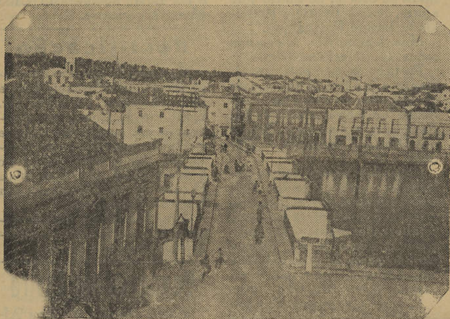
A velha ponte romana de Tavira