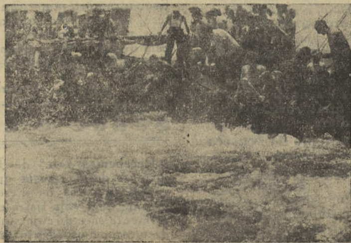
Uma fase dum copejo de atum

Nos dias de grande copejo, a luta tem mais colorido e o espectáculo torna-se mais belo. Ver um « copo » pejado de grandes peixes é uma alegria que se transmite a toda a companhia, e o cenário é bem digno duma objectiva cinematográfica.