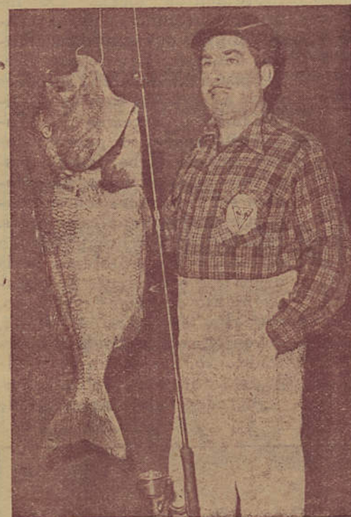
15,860 kgs., ex-Record Nacional

Às 24 horas — Distribuição de prémios a realizar durante o Festival em honra dos concorrentes.