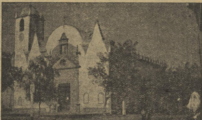
A igreja matriz de Luz de Tavira

popular, da «Luz às escuras», pois, por portaria de 6 do corrente, publicada no «Diário do Governo», foi autorizada a Câmara de Tavira a contrair na Caixa Geral de Depósitos, Crédito e