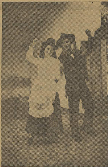
Um gracioso par do Rancho de Santo Estêvão

R EGRESSOU de Lisboa, depois duma brilhante exibição no Pavilhão dos Desportos, onde, conforme noticiámos, a convite da F.N.A.T., foi colaborar na festa de encerramento da Exposição de