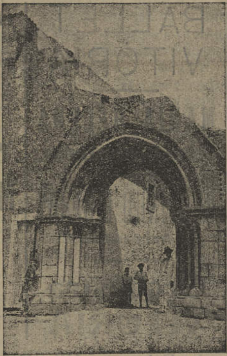
Lindo Pórtico do Convento da Graça, do Loulé

Denro da sua modestia aparente, o Circo Victória é constituído por bons artistas e os seus trabalhos são merecedores de aplausos.