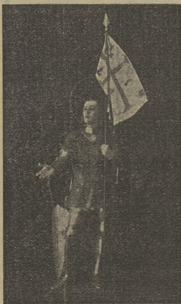
Imagem do Santo Condestável que se venera em Tavira

Na Igreja de Santa Maria do Castelo, faz-se comemoração do Beato Nuno e panegrico, à missa solene das 11 horas.