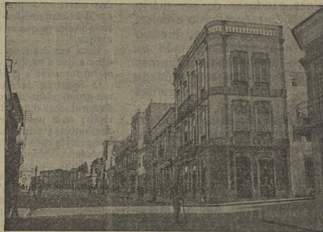
Loulé — Praça da República