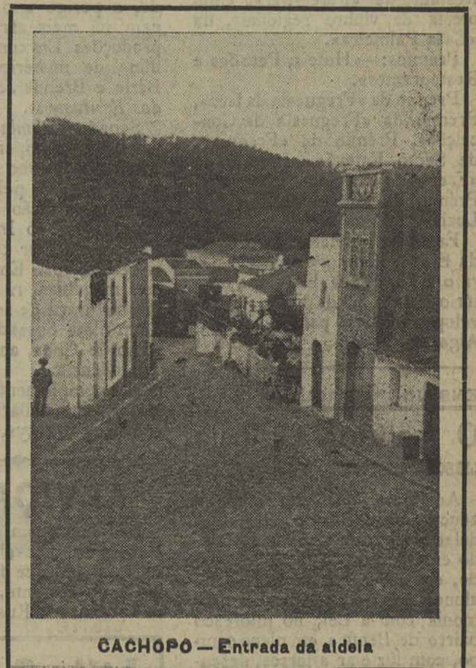
CACHOPO — Entrada da aldeia

e confia. Esta gente tão portuguesa e simples sabe que a palavra dos Homens do Estado Novo não é coisa vã e há-de cumprir-se; e, assim, espera que seja criada,