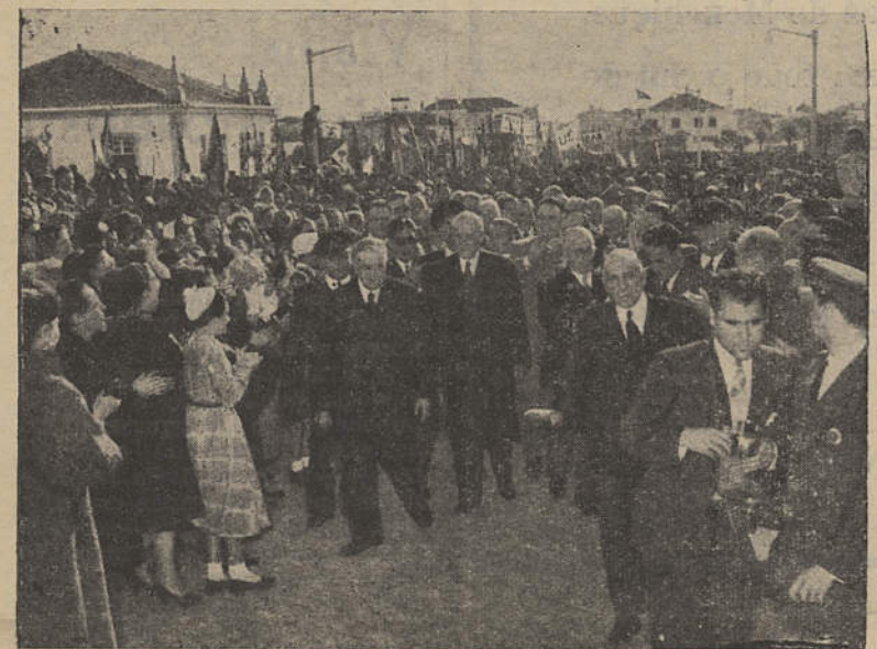
No dia 16 de Novembro de 1952, Salazar visitou oficialmente Loulé e esse foi um motivo de orgulho para os louletanos que o aplaudiram entusiasticamente.

vit e saudar o ilustre Chefe do Governo, que aqui se quis deslocar para com o alto valor da sua presença dar a essa homenagem o mais alto significado de gratidão pelo homem que foi indiscutivelmente, o maior colaborador e o mais prestigioso obreiro da sua obra de reconstrução Nacional.