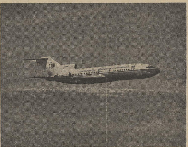
Ao longo dos 5 anos em que operam no Algarve, os aviões da TAP têm sido um importantíssimo factor de progresso na conjuntura turística do Algarve, transportando muitos milhares de pessoas que, de outra forma, não teriam vindo até nós.