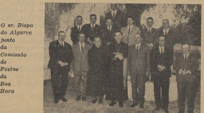
O sr. Bispo do Algarve junto da Comissão de Festas da Boa Hora